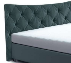
24024 Höhe 128 cm gegen Aufpreis