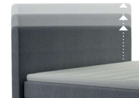
0300 Multimaß Höhe 70 - 125 cm in 5cm-Schritten kürzbar gegen Aufpreis