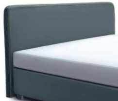
24027 Höhe 115 cm Standard