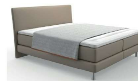
Typ 100 Plaid Klassik komplett geöffnet deckt die Liegefläche nicht ab.

Bitte bei Bestellung (vor allem Einzel- oder Nachbestellung) immer die Bettmaße angeben. Die angegebenen Maße sind ca. Maße. Geringfügige Maßabweichungen zur Liegefläche plus Volanthöhe sind produktionsbedingt