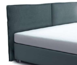
24028 Höhe 116 cm gegen Aufpreis