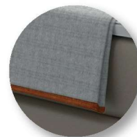
Typ 100 Plaid Klassik Kanten mit Einfassband paspeliert