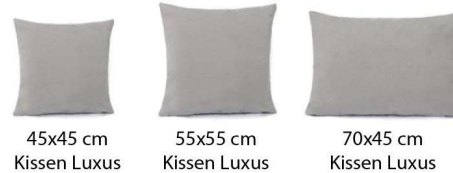
45x45 cm Kissen Luxus